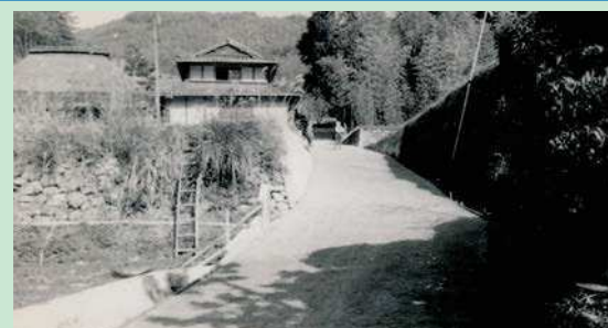
昭和40年代の写真と思われる。当時の平均的な農家の家屋が映っている。