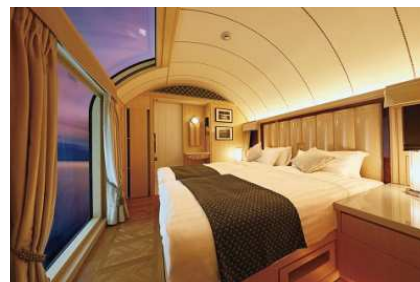
ザ・スイート 寝室

直近の通過日6月27日は、なんと安浦駅に停車します!早朝ですが迫力ある雄姿を歓迎しましょう。