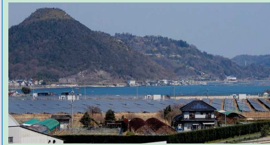
塩田は姿を消し、畑と大型のソーラー発電設備が設置された。三津口湾の向側にある飯野山も頂上が削り取られている。