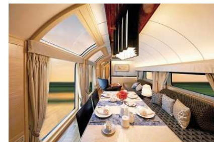
ザ・スイート リビング