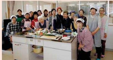
女性教室の皆さん