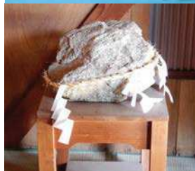
「岩清水八幡漁師の網に」※伝承では八幡神社（四国）の八幡神。制作：1978（昭和53）年5月10日／往事の言い伝えなどを参考に制作したもの