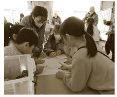
1月31日(金) 安登小学校