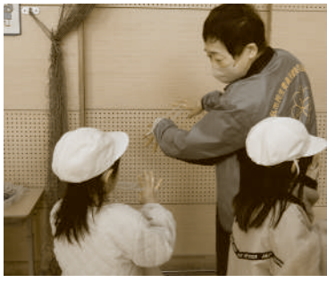
1月28日(火) 安浦小学校

1月28日(火)と31日(金)、町内の小学校で「むかしあそび」でふれあう会が行われました。民生委員・児童委員と1年生の児童が、けん玉やお手玉、こま、あやとり、おはじきなど昔の遊びを体験し交流を深めました。