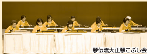
琴伝流大正琴こぶし会