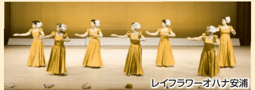
レイフラワーオハナ安浦