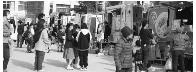
令和5年度 安浦新ええとこ祭