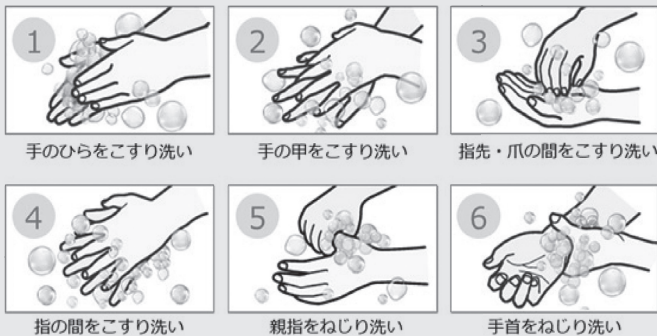
厚生労働省の推奨する正しい手洗い6ステップ