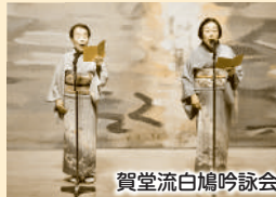
賀堂流白鳩吟詠会