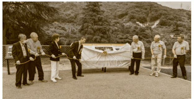
災害説明板の除幕の様子

7月13日(土)、市原・中畑・下垣内を結ぶ「いなしふれあい広場」に整備された、一時避難場所の完成式が行われました。同所には西日本豪雨災害の記憶を継承するための説明板も設置され、同時に行われた避難訓練や住民説明会には3地区の住民が合同で参加しました。