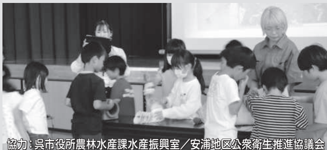
協力：呉市役所農林水産課水産振興室／安浦地区公衆衛生推進協議会

6月5日(水)，3年生の児童が実際の漁業の道具に触れたり，生きた魚やカブトガニを間近で観察したりしながら，呉市の水産業について学びました。