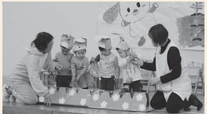
12月9日(土) 安浦中央保育所