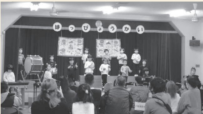
12月2日(土) 安登保育所