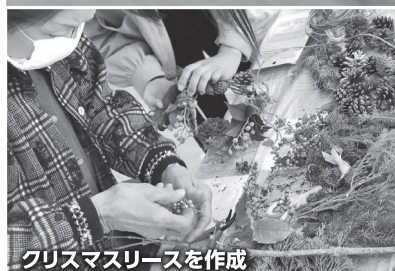
クリスマスリースを作成