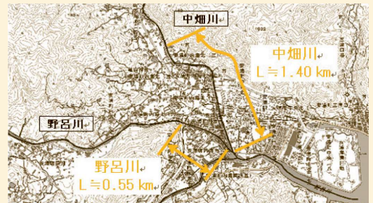
河川工事の施行場所

今後も、呉市と連携し、関係住民の皆様と意見交換を図りながら、河川改修に向けて取り組んでまいります。