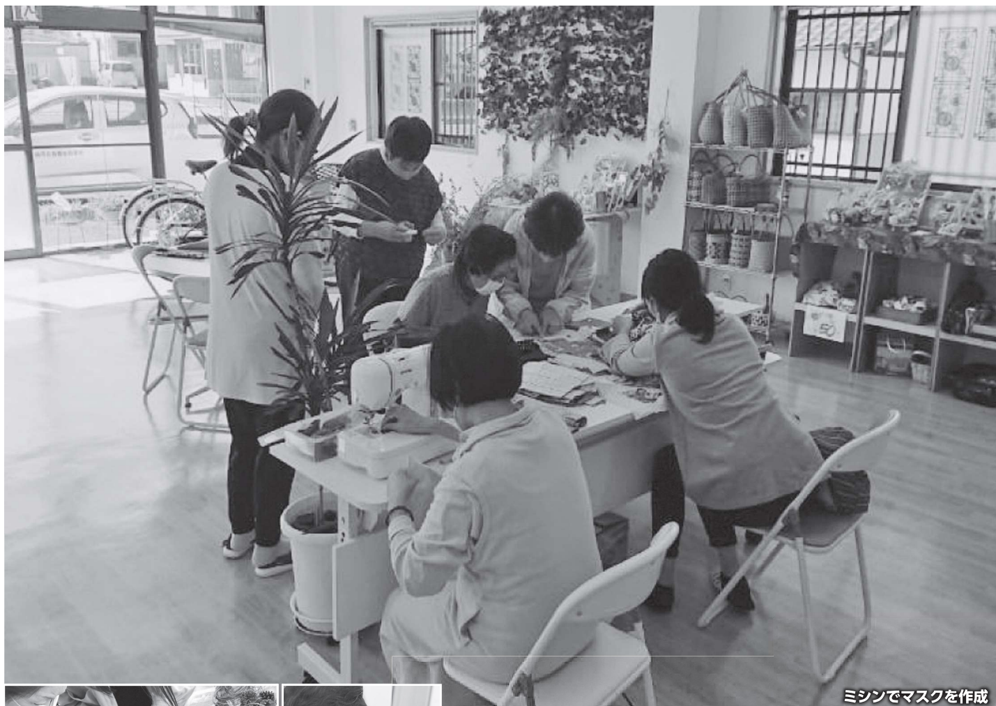
ミシンでマスクを作成