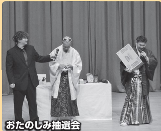
おたのしみ抽選会