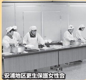
安浦地区更生保護女性会