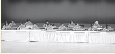
琴伝流大正琴 こぶし会