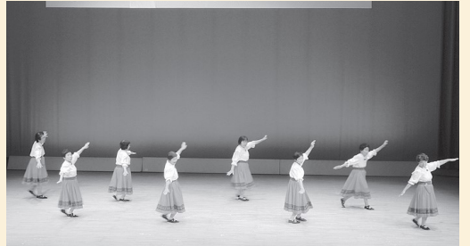
サークルきらめき