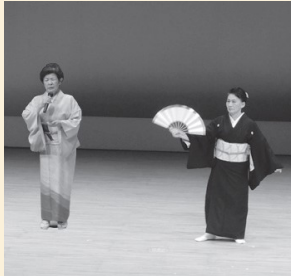
吟道賀堂流 白鳩吟詠会・利鳳会