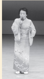
吟道賀堂流 白鳩吟詠会