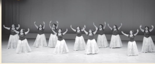
レイフラワーオハナ安浦