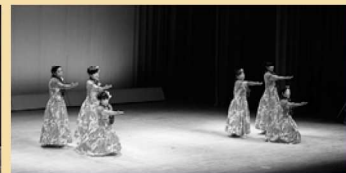
レイフラワーオハナ安浦