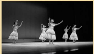
レイフラワーハイビスカスあと