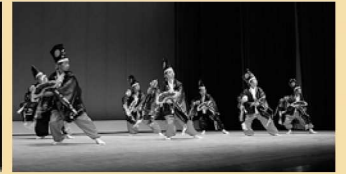
安浦町女性連合会