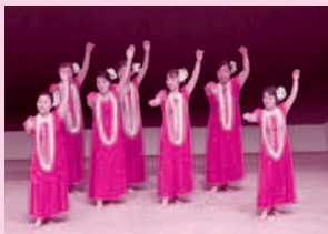
レイフラワーオハナ安浦