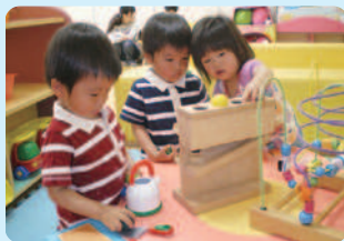
おもちゃもあるよ!