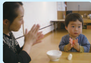
この日は粘土遊びでした