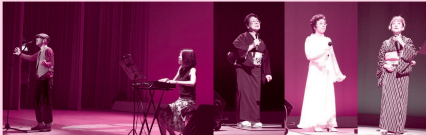
地域の代表による歌謡ショー