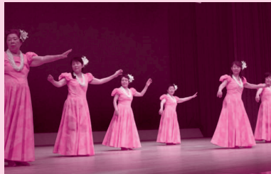
レイフラワーオハナ安浦